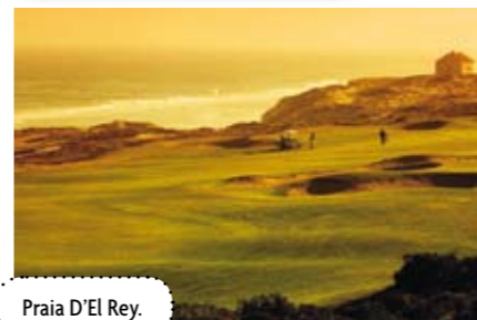
Praia D'El Rey.